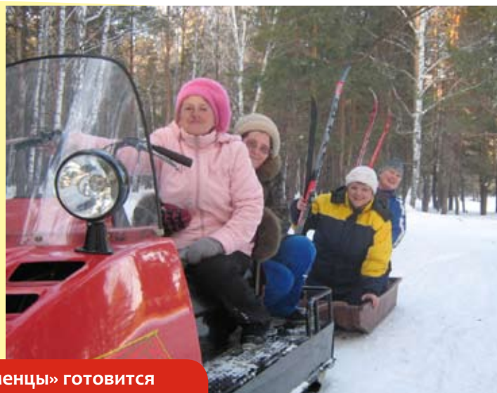
Команда «Тальменцы» готовится к спортивным состязаниям

Да и самую новую, самую красивую, самую оснащенную школу района МОУ ТСОШ №6 подводить нельзя. Конечно, непросто было решиться на участие в таком ответственном мероприятии, но теперь нам ничего не страшно!